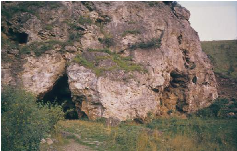
Abb. Auf dem in der Altsteinzeit befestigten Vorplatz der „Kniegrotte“ fand das tägliche Leben statt.

Die „Kniegrotte“ befindet sich ca. 4 km südöstlich von Pößneck, nahe dem Dorf Döbritz. Nach einem kurzen Aufstieg, vorbei am Döbritzer Natur-Freibad, erreicht man die heute noch etwa 9,50 m lange, 5 m breite und maximal 3 m hohe Höhle. Sie wurde 1930 von M. Richter entdeckt und in den folgenden acht Jahren von ihm und zahlreichen Helfern vollständig ausgegraben. Das sehr umfangreiche Fundinventar (fast 14 500 Stücke) besteht aus Steinwerkzeugen, Werkzeugen aus Geweih, Elfenbein und Knochen sowie Schmuck- und Kunstgegenständen. Die „Kniegrotte“ erfüllt auf Grund der intensiven Feuernutzung, der umfangreichen Geräteherstellung und nicht zuletzt mit einmaligen Schmuckformen alle Kriterien eines großen Basislagers der nomadisierenden altsteinzeitlichen Jäger und Sammler. Die Funde und Befunde der „Kniegrotte“ sind der bislang älteste Beleg für eine Besiedlung im Thüringer Becken während der jüngeren Altsteinzeit ( Höck 2000, S. 154 ).