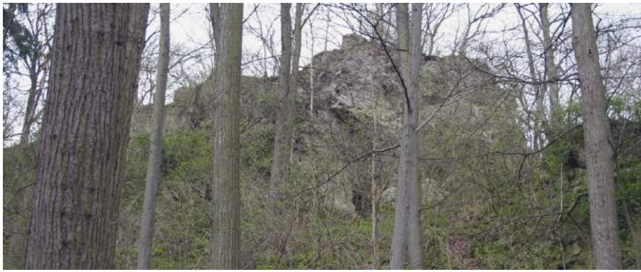
Abb. Im unteren Bereich des Zechsteinmassivs ist einer der stark verstürzten Zugänge zur Richterhöhle noch erkennbar.