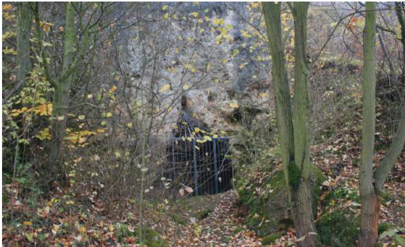
Abb. Links und rechts des heute verborgen liegenden Eingangs zur „Urdhöhle“ ist noch die ehemalige Geländehöhe zu erkennen.

Nur wenige hundert Meter nördlich der Kniegrotte und ca. 22 m über dem Gamsenbachtal befindet sich die ebenfalls von M. Richter entdeckte „Urdhöhle“. Er benannte sie nach der germanischen Göttin „Urd“ und hielt sie für eine eiszeitliche Kulthöhle. Sie gehört zu einer Nord-Süd streichenden Zerreißungszone am Rand des Zechsteinriffs, die in verschiedene Abschnitte unterteilt werden kann – von M. Richter mit „Kultkammer“, „Hochkammer“, „Südhalle“, „Einbruchskessel“ und „Oberhalle“ bezeichnet. Besondere Bedeutung erlangte die Fundstelle durch die Entdeckung von menschlichen Skelettresten, bemerkenswerten altsteinzeitlichen Werkzeugen und einem aus dem Schädelknochen eines Rentiers gefertigten Bärenköpfchen ( Museum Burg Ranis; Walter 1985, S. 23 ). Die menschlichen Skelettfunde konnten durch neue wissenschaftliche Untersuchungen in die Mittelsteinzeit eingeordnet werden ( Terberger/Küßner/Schüler/ Street 2003, S. 10 ).